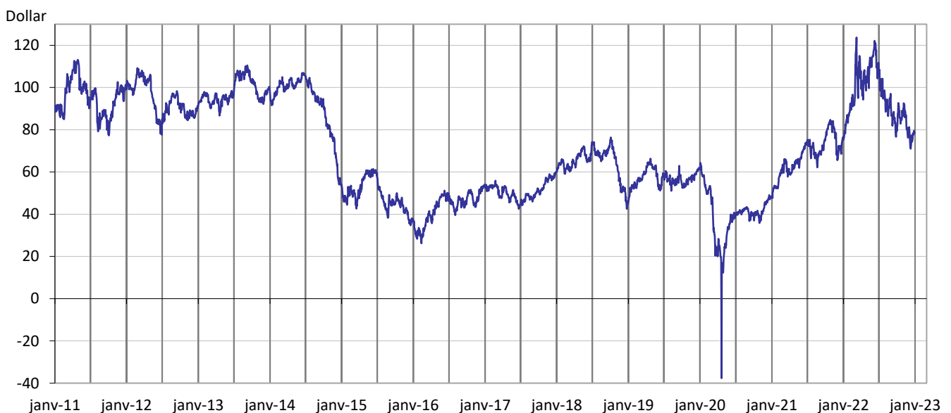
Baril de pétrole à New-York depuis 2011

Sincères salutations L'équipe de C. Giraud & Cie.